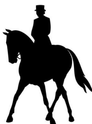
Схема езды для любителей. Начальный уровень.

*Настоящее Положение имеет юридическую силу при наличии согласования по обеспечению безопасности, охраны общественного порядка и антитеррористической защищенности администрации муниципального образования, места проведения соответствующего Мероприятия, включенного в календарь мероприятий.